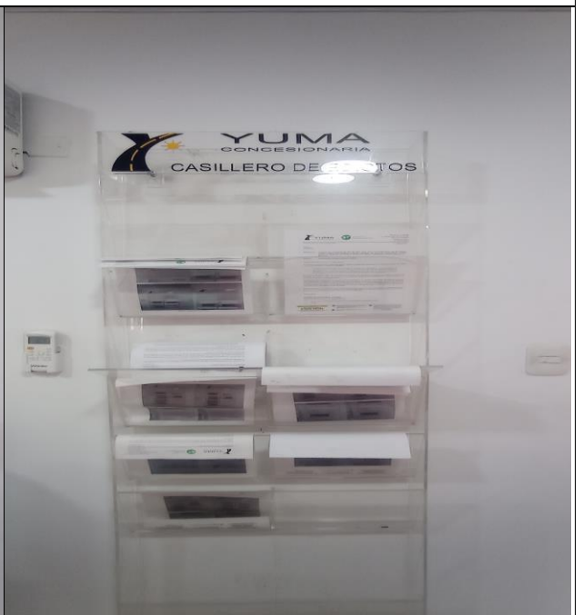
EDICTO R_37633 YC-CRT-128762